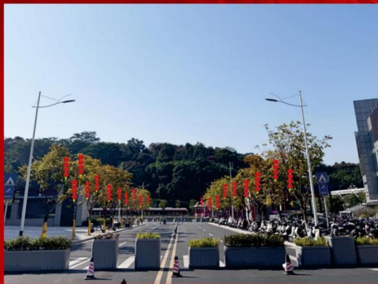
道路两侧树木红灯笼装饰