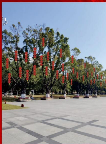
公园内树木红灯笼装饰